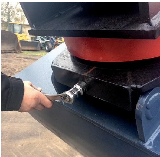
Työkalun lukitusruuvi auki-asentoon.