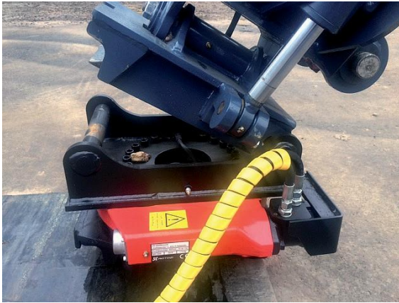
Liittimen kiinnitys pyörittäjään.