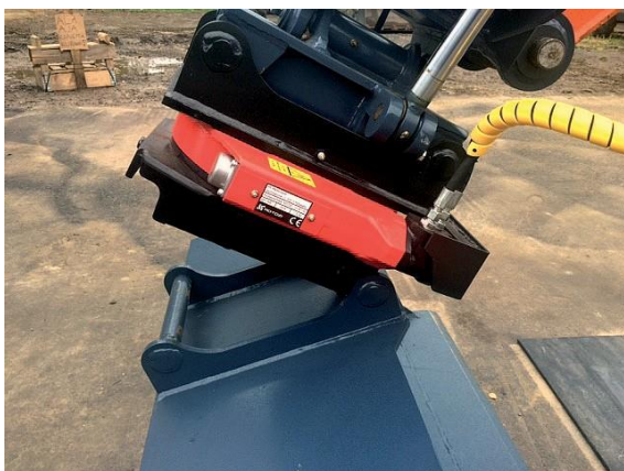
Työkalun kiinnitys pyörittäjään.

Työkalu tulee kiinnittää aina siten, että murtovoima (kaivuvoima) kohdistuu sovitteeseen/liitimeen eikä kiilaan.