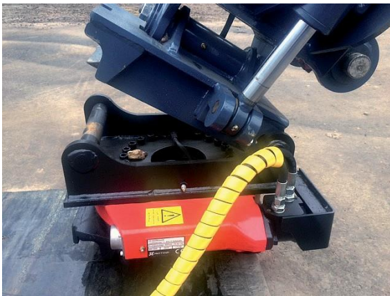
Pyörittäjän irrotus liittimestä.